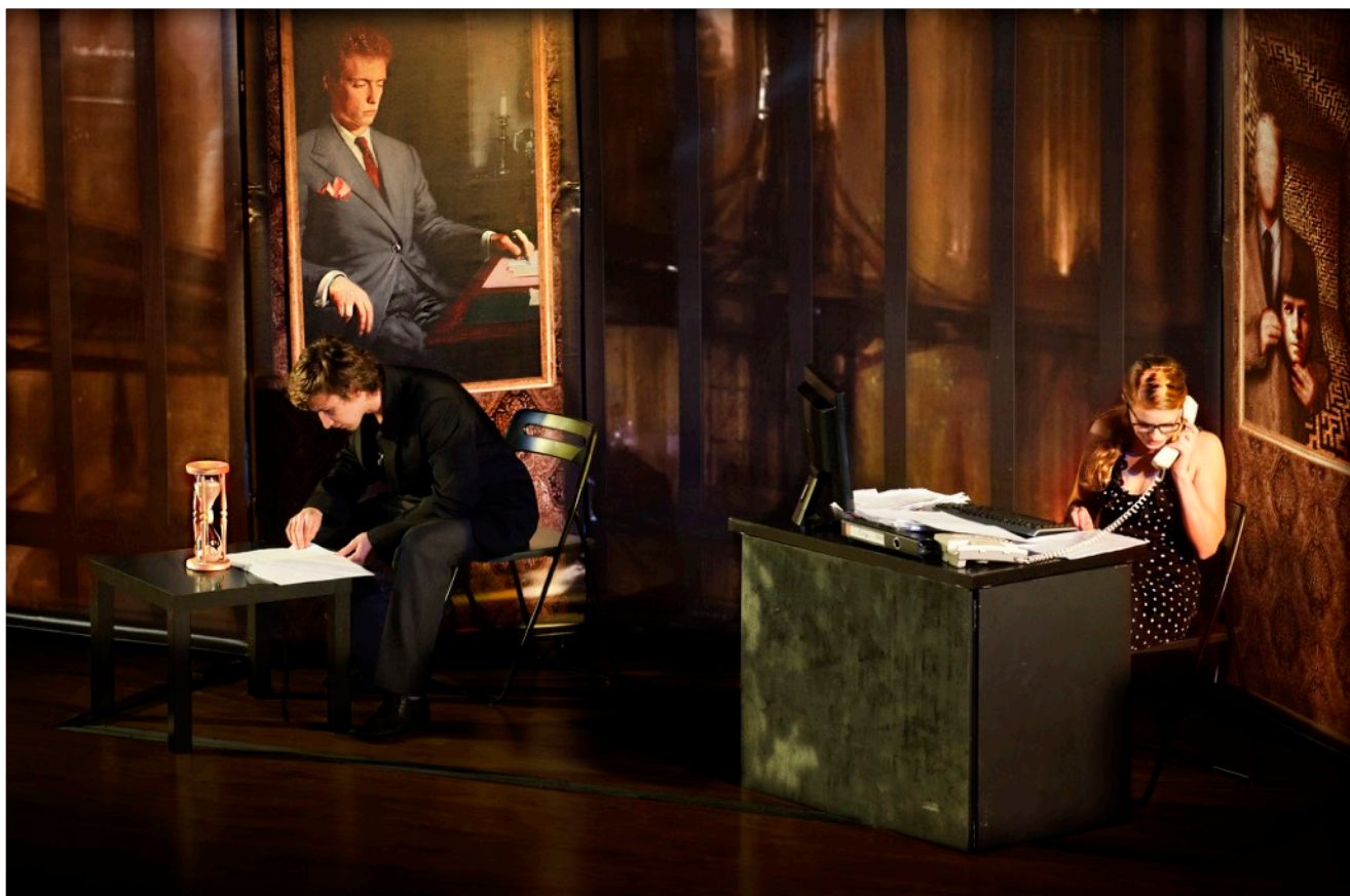
Zdjęcie ze spektaklu „Hejter” Teatru Profilaktycznego ALERT

Zadaniem Teatru Profilaktycznego ALERT jest efektywne informowanie i pobudzanie do dialogu, mówienie o aktualnych problemach i skłanianie do szukania ich rozwiązań. Jednak sztuka jest otwarciem na drugiego człowieka i dopełnia się dopiero w połączeniu z odbiorcą.